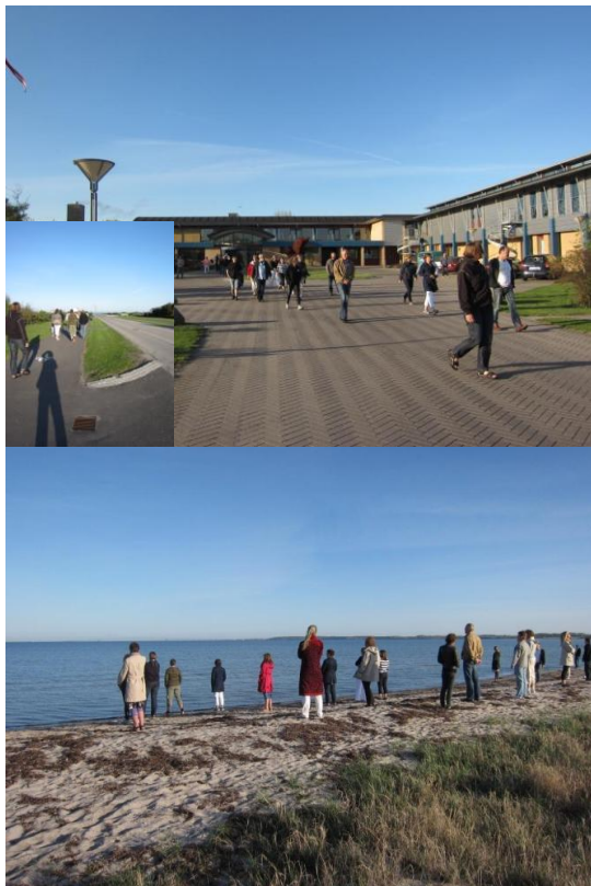
Kobæk Strand, 29. april, kl. 7.40 – bestyrelsesmedlemmer og skoleledere skuer mod nye horisonter

Nyt ansigt valgt til bestyrelsen på et vellykket Bestyrelsestræf 2011 med høj aktivitet og masser af inspiration mellem deltagerne og fra Teori U